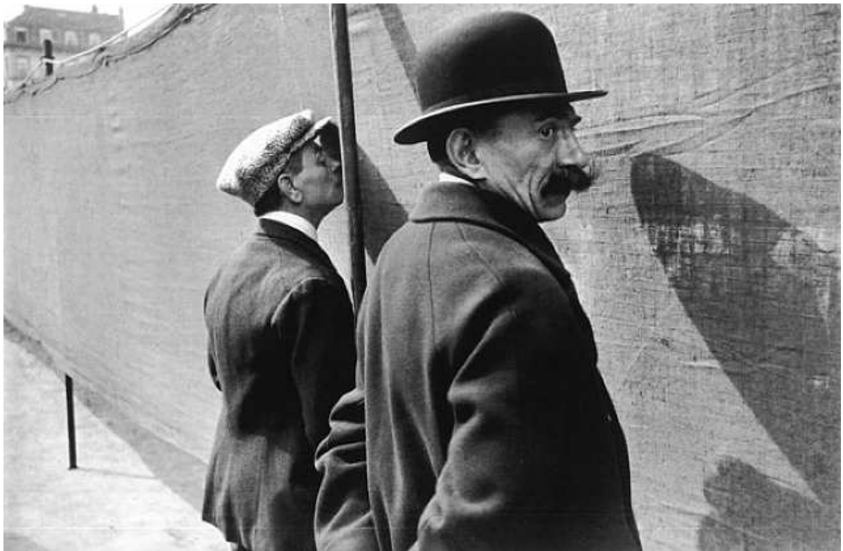
Henri Cartier-Bresson, Brussels, Belgium , 1932